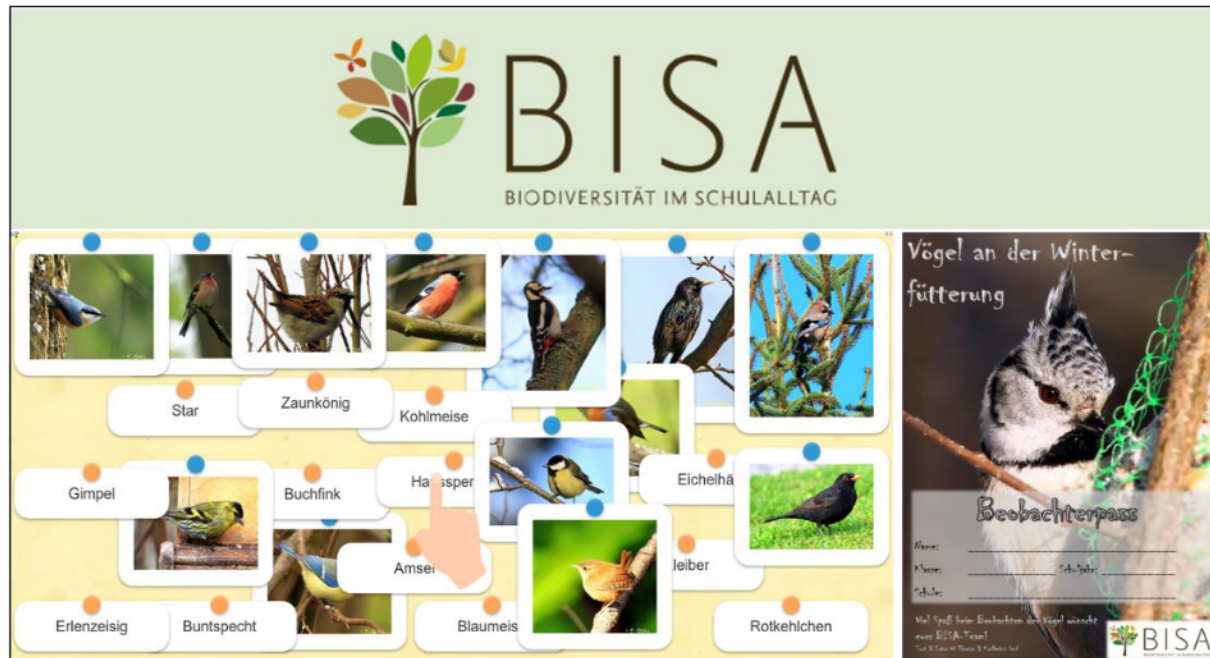
Abbildung 4: Beispiel Online-Spiel und Beobachterpass zur Dokumentation eigener Beobachtungen von Vögeln auf www.bisa100.de

Da die empirischen Untersuchungen zur Artenkenntnis zeigten, dass es Kindern besonders schwerfällt, einheimische Vogelarten zu erkennen, wurden speziell für diese Tiergruppe eine Vielzahl von Materialien entwickelt und in didaktischen Fachzeitschriften publiziert (Gerl et al. 2017; Gerl 2020b, 2020c, 2020d). Im Projekt „Biologie macht SchulePLUS“ können Lehramtsstudierende nicht nur ihre Artenkenntnis verbessern, sondern auch ihre digitalen Kompetenzen erweitern, indem sie digitale Inhalte zu Biodiversitätsthemen erstellen. Der Transfer von biologischen Inhalten in die Schule ist geglückt. Besonders die digitalen Medien schafften es, die Lehrkräfte nach der Bekanntgabe von coronabedingten Schulgebäudeschließungen in ihren Unterrichtsvorbereitungen bei dem Thema Biodiversität zu unterstützen. Dies wird durch die ca. siebenfache Erhöhung der vierzehntägigen Zugriffszahlen auf der BISA Webseite deutlich und spiegelt den Bedarf an digitalen Inhalten zur Unterrichtsgestaltung wider (Abbildung 5). Studentische Hilfskräfte, die durch das Projekt „Biologie macht SchulePLUS“ finanziert wurden, leisteten dazu einen wertvollen Beitrag.