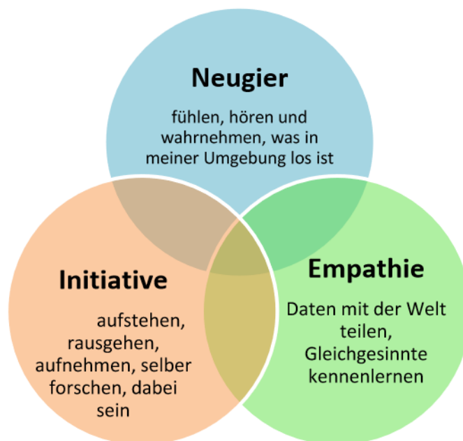
Abbildung 2: Werte von BIOTOPIA, Neugier, Empathie und Initiative im „Dawn Chorus“-Projekt