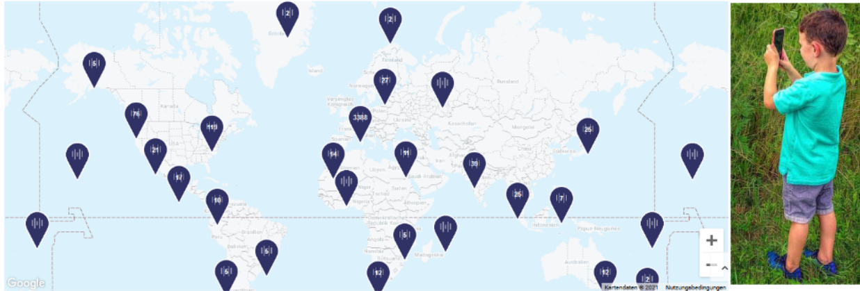
Abbildung 3: Statisches Bild der interaktiven Karte auf https://dawn-chorus.org/vogel-chor/ . Hier sind u.a. die eigenen aufgenommenen Vogelstimmen wiederzufinden und anzuhören.

Das „Dawn Chorus“-Projekt wird über mehrere Jahre Daten sammeln, um in Zusammenarbeit mit Wissenschaftspartner:innen Fragestellungen zu Themen wie Artenvielfalt, Urbanisierung und Lärmverschmutzung auf den Grund zu gehen (vgl. https://dawn-chorus.org/idee/#wissenschaft , aufgerufen am 15.2.2021, Gill 2020). Dafür wäre es besonders wünschenswert, über Jahre hinweg Aufnahmen von denselben Orten zu erhalten, um die Biodiversität von Vögeln zu monitoren.